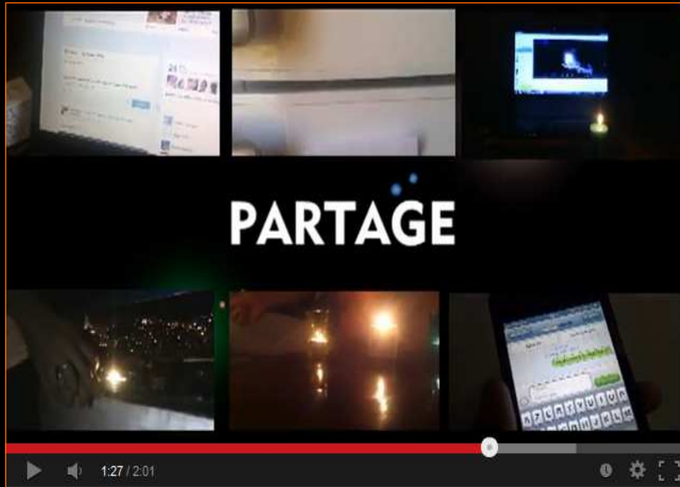
Vidéo promotionnelle du TenTen 2013 sous le signe du Partage

Youtube : http://www.youtube.com/watch?v=ew_Zqi81ICK