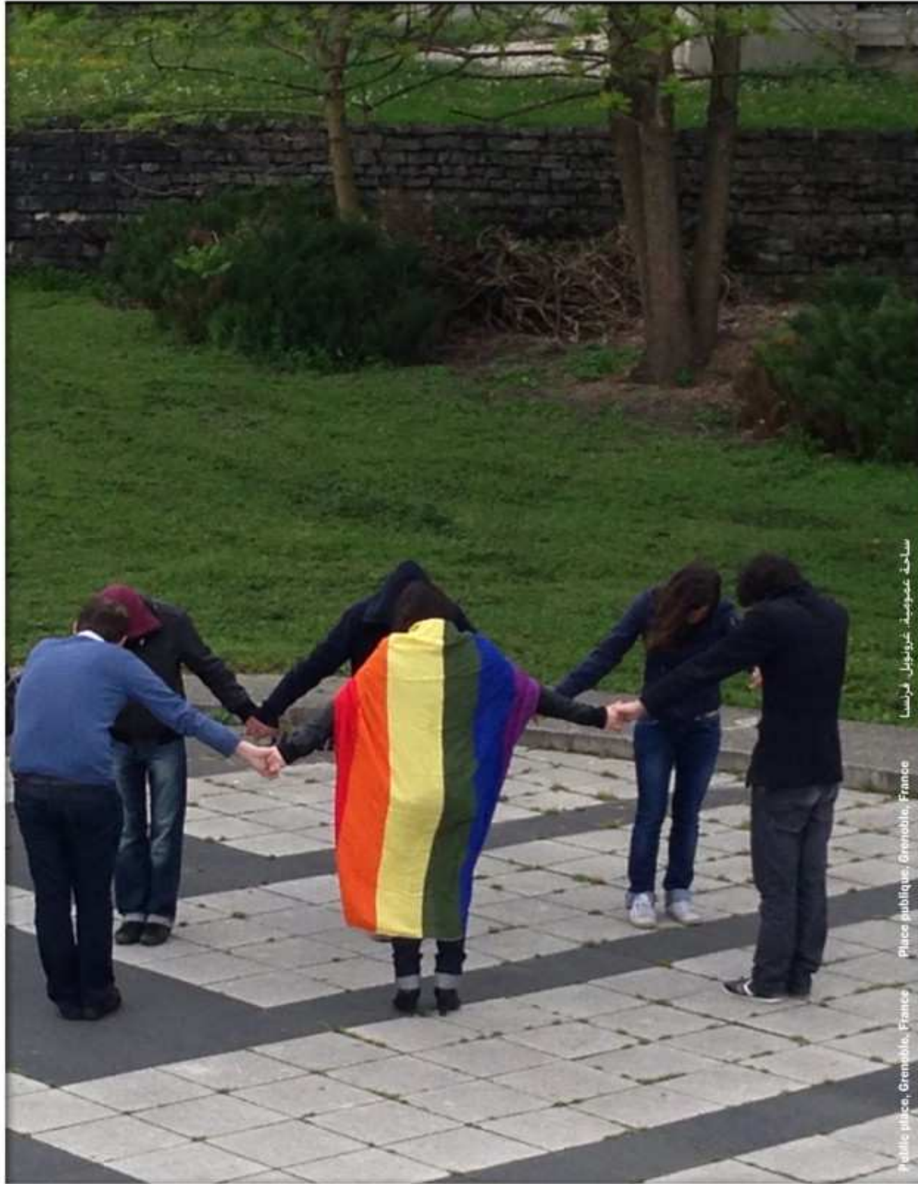
ساحة عتيبة، غرنبول، فرنسا