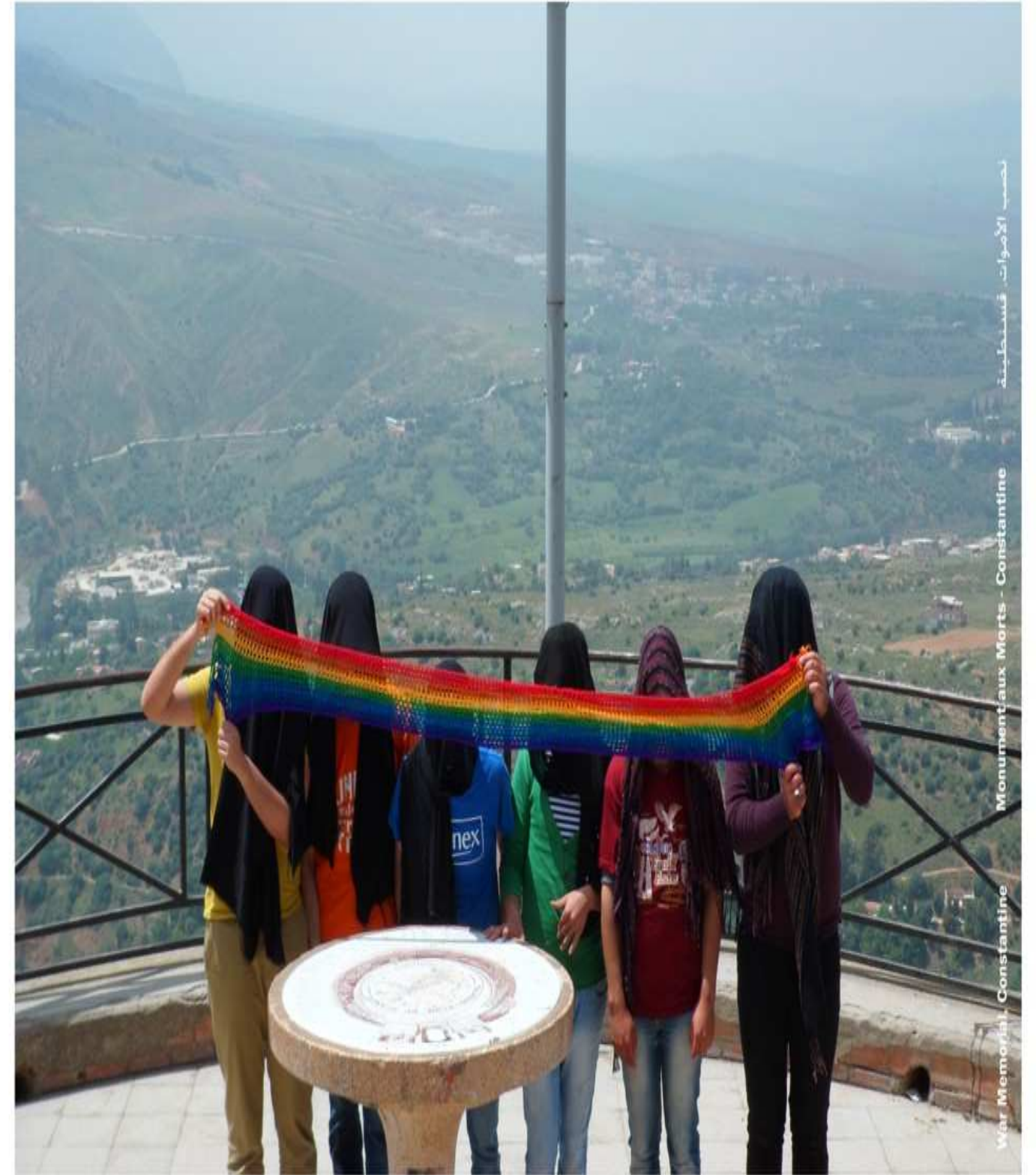
نصب الأموات، قسنطينة