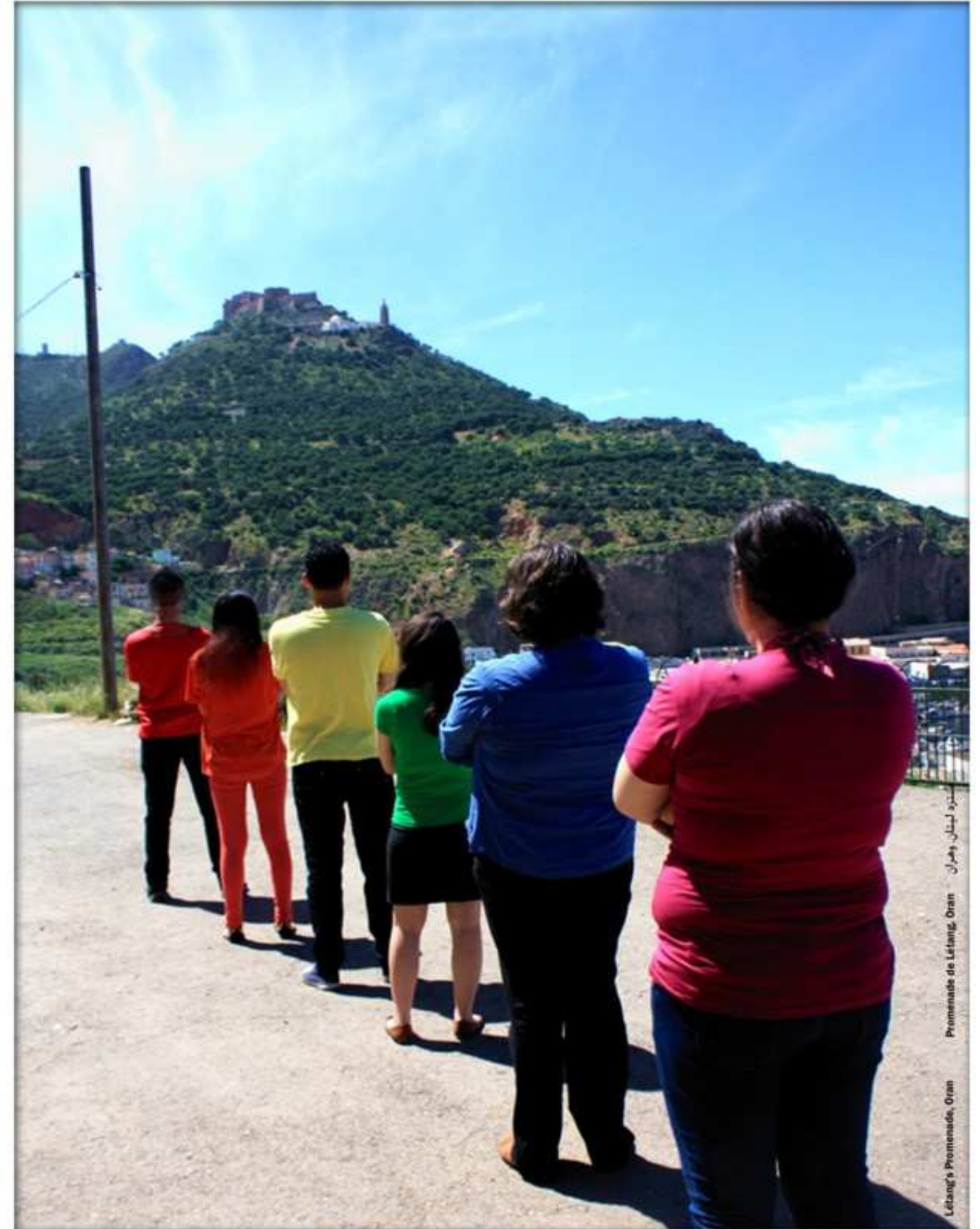
شبكة لبيات وهران Promenade de L'étang, Oran L'étang's Promenade, Oran