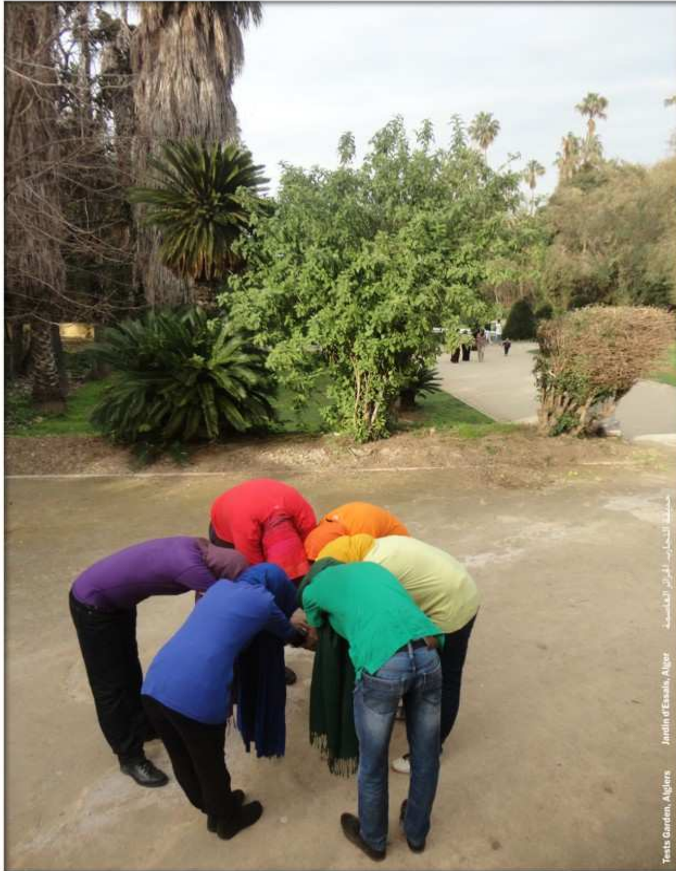
جمعية التمييز العنصري Jardin d'Essais, Alger Testis Garden, Algiers