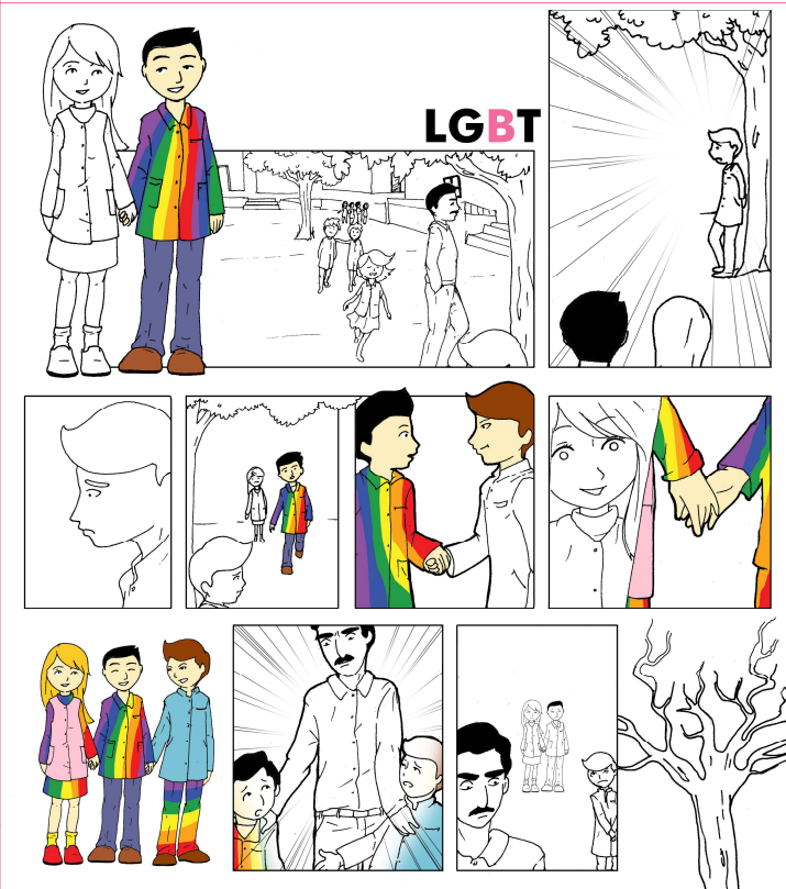
La nature ne connaît pas l'homophobie, la société si.