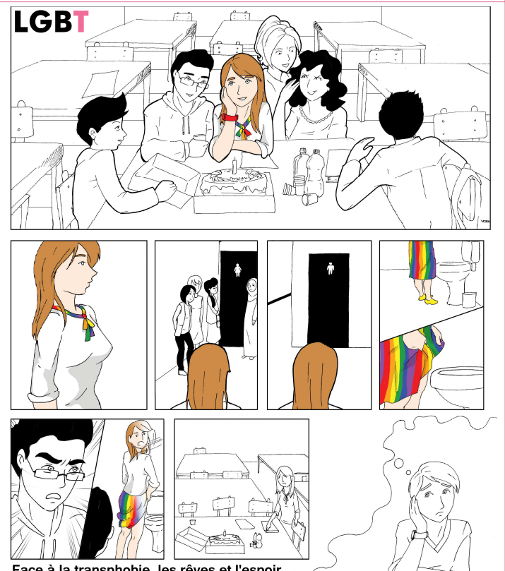
Face à la transphobie, les rêves et l'espoir ne sont pas permis ...