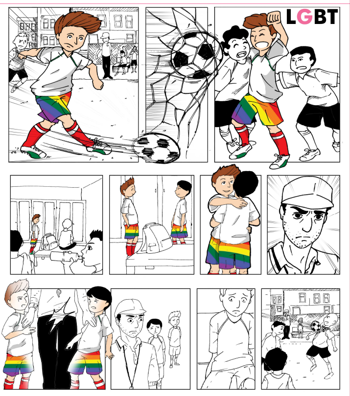
L'homophobie met les LGBT en marge du terrain et de la société.