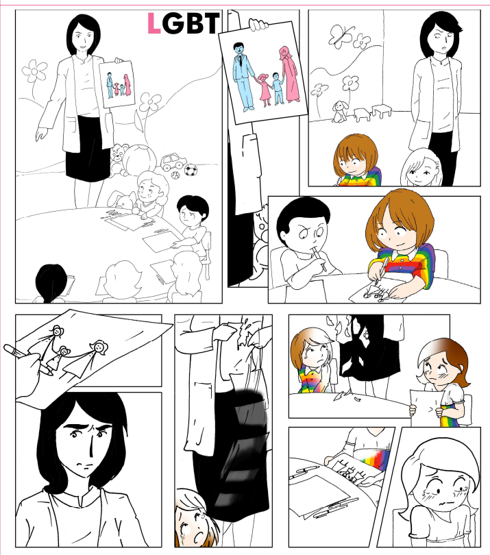
Les enfants ne connaissent pas l'homophobie, les adultes si.