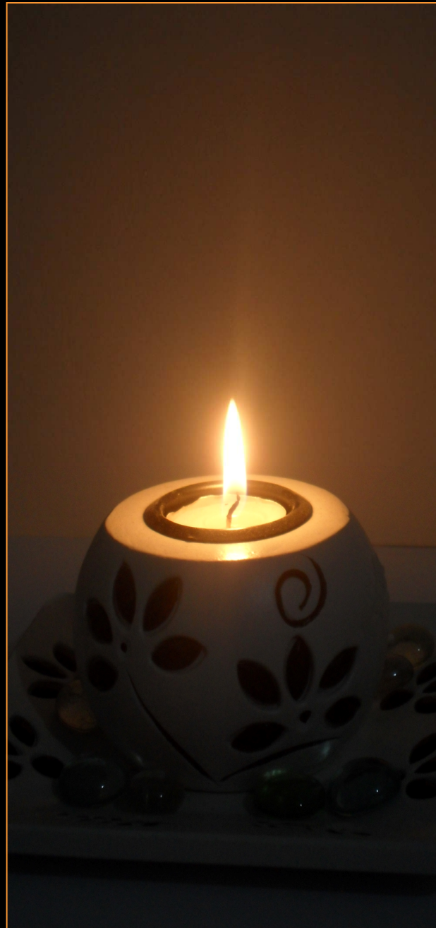
« La Bougie de Kenza »

Nous rajouterons les autres témoignages sur Le TenTen dans les prochains numéros